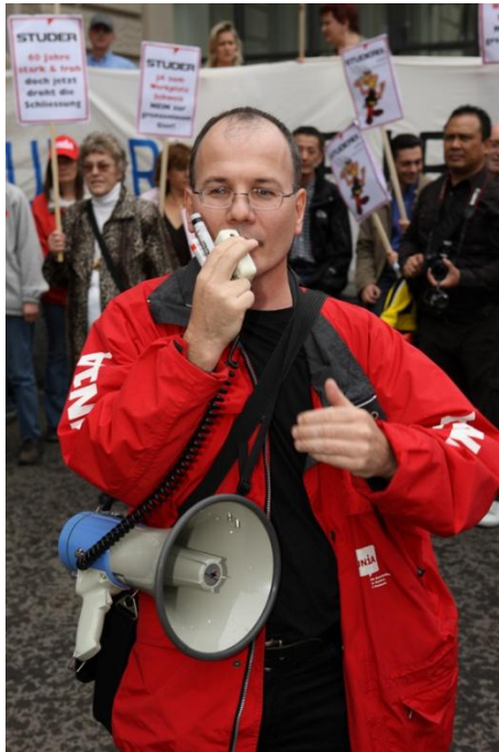
Bild oben: Unterstützung einer Aktion der Grenzwächtergewerkschaft garanto, Basel 2010. Bild links: Kundgebung für den Erhalt von Arbeitsplätzen, Zürich 2009. Bild unten: Solidaritätsaktion von Amnesty International, Bern 2009. Bild rechts: „Sessionsbericht aus Bern“, Klingnau 2010.